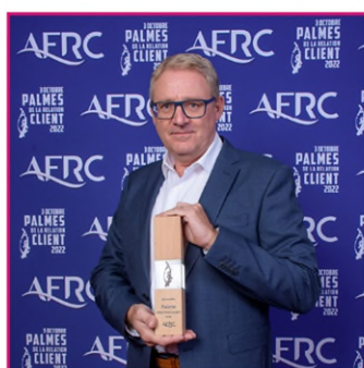
Palme de l'Expérience Client Macif