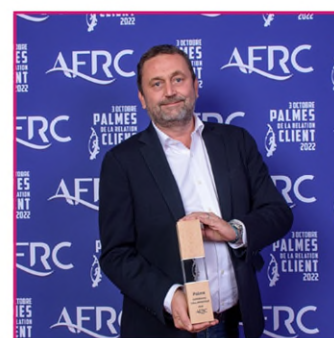
Palme Expérience Collaborateur Disneyland Paris