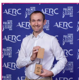
Palme Jeune pousse Potions