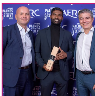
Palme de l'Expérience Citoyen Pôle Emploi