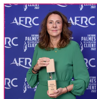
Palme de l'Expérience Client La Banque Postale